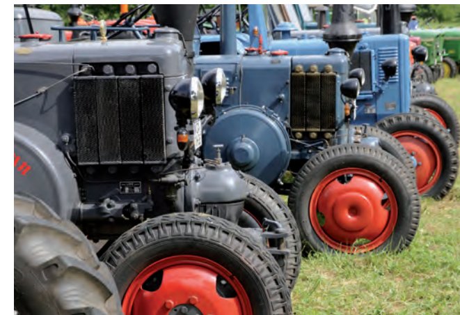
Hinweis: CCMC-Motorenöl-Spezifikationen erfüllen weitgehend API-Klassifikationen, API-Klassifikationen erfüllen CCMC-Anforderungen umgekehrt nicht vollständig. Die Anforderungen der Tests im Rahmen der ACEA können nicht direkt mit den Anforderungen der CCMC- und API-Spezifikationen verglichen werden. Beachten Sie die Angaben der Motoren- und Aggregatehersteller.

Quelle: vgl. Mineralölalphabet kompakt, S. 20-21, Hg.: Technischer Dienst UNITI, Hamburg 2007